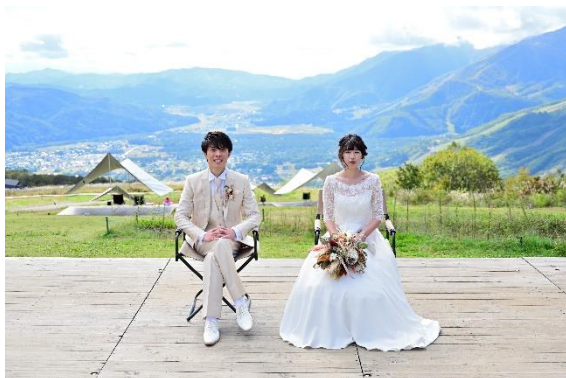
▲「白馬岩岳」のイメージ写真①