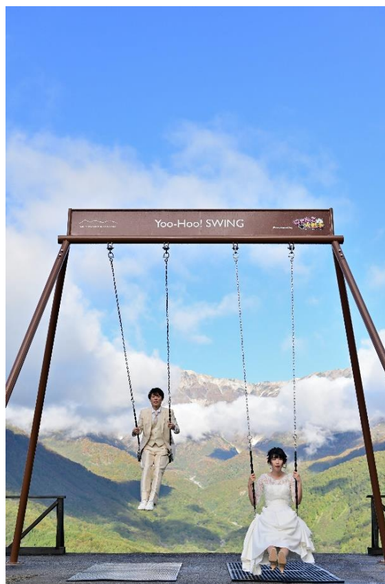
▲「白馬岩岳」のイメージ写真②