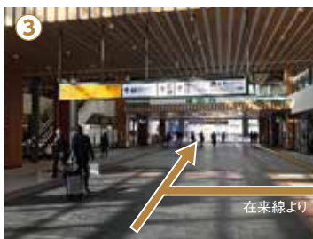
③ 在来線をご利用のお客様は、在来線改札口を出て右側(善光寺口)方面にお進みください。