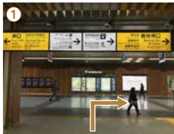
① 新幹線をご利用のお客様は、新幹線改札口を出て右側(善光寺口)方面にお進みください。