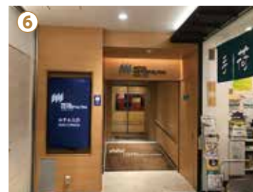
⑥ 突き当りにホテルメトロポリタン長野の接続口がございます。フロントカウンターは1階となります。