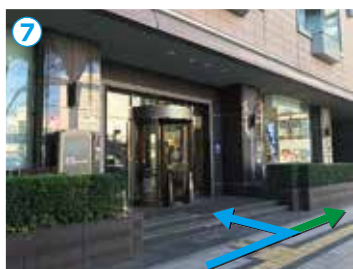
⑥の突き当りを右に曲がりますと左側に入口がございます。