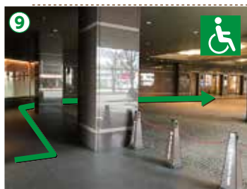
⑧ カベ沿いにお進みいただきますと正面玄関に到着いたします。