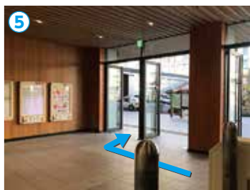
④の突き当り左側にエレベーター、エスカレーター、階段がございます。何れかで1階にお進みください。