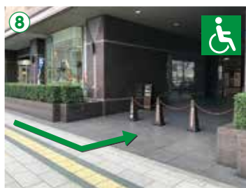
⑦ 車椅子をご利用のお客様は、⑧のスロープからお進みください。