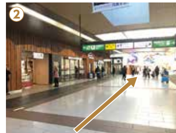
② 長野駅東西自由通路を善光寺口方面にまっすぐお進みください。

※④~⑥のルートは5:30~24:30までご利用いただけます。上記時間外またMIDORI長野が休館の場合は、⑤以降のルートにお進みください。