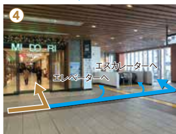
④ 左側のMIDORI長野「信州おみやげ参道ORAHO」の入口からお進みください。